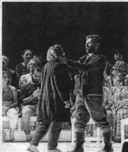
Le te sauve de tes ravisseurs, ok. Mais as-tu été fidèle ? Les salauds ne sont pas toujours ceux qu'on imagine.