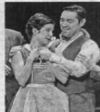
Les noces de Figaro, première production.