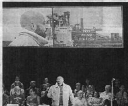
Pour accompagner la pièce un film a été tourné à Dunkerque, retraçant toute l'intrigue de l'opéra.