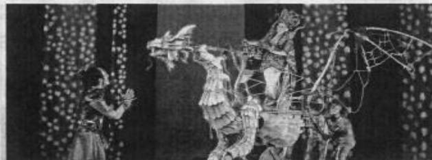
Incroyable Rinaldo l'an dernier avec une mise en scène signée Claire Dancoisne.

Noces de Figaro de Mozart, Gli anni sciocchi de Puccini et Rinaldo de Haendel. Pour cette saison 2018-2019, la Co[opéra] tive a choisi L'Enlèvement au sérail de Mozart. Et c'est à Besançon que tout a été fait : des décors, costumes, mais aussi répétitions.