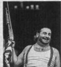
Gli anni sciocchi , première représentation en 2017. DR