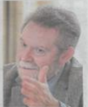
Le recteur est allé en personne sur le terrain pour bien expliquer le dispositif.

Cette année, avec les améliorations apportées à la plateforme, on verra si le message a porté.